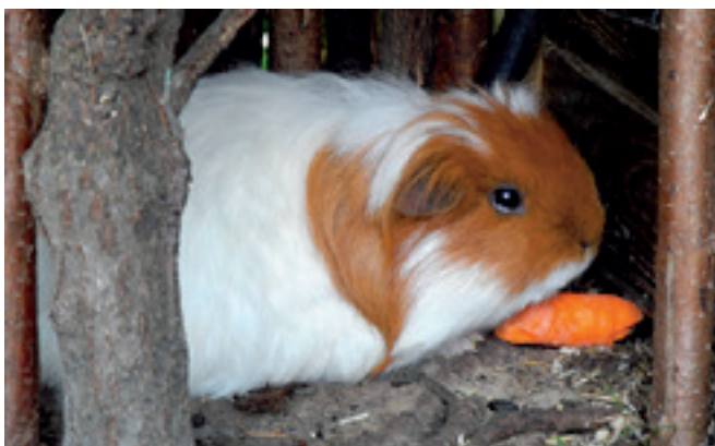
Ein Häuschen spendet Schatten.

Das Wasser im Aquarium kann sich für die Fische lebensbedrohlich aufheizen. Notfalls sollte vorsichtig kaltes Wasser nachgefüllt werden, um das Schlimmste zu verhindern.